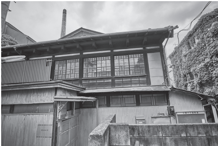
三田小山町にあった小山湯