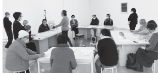
左：地域の建築レクチャー、2022年12月 右：オブジェクト・ベスト・ラーニングのワークショップ、2023年1月

「物語の集積として都市文化を捉える」という観点であり、毎年発行された報告書にもそれは、明確に示されている。