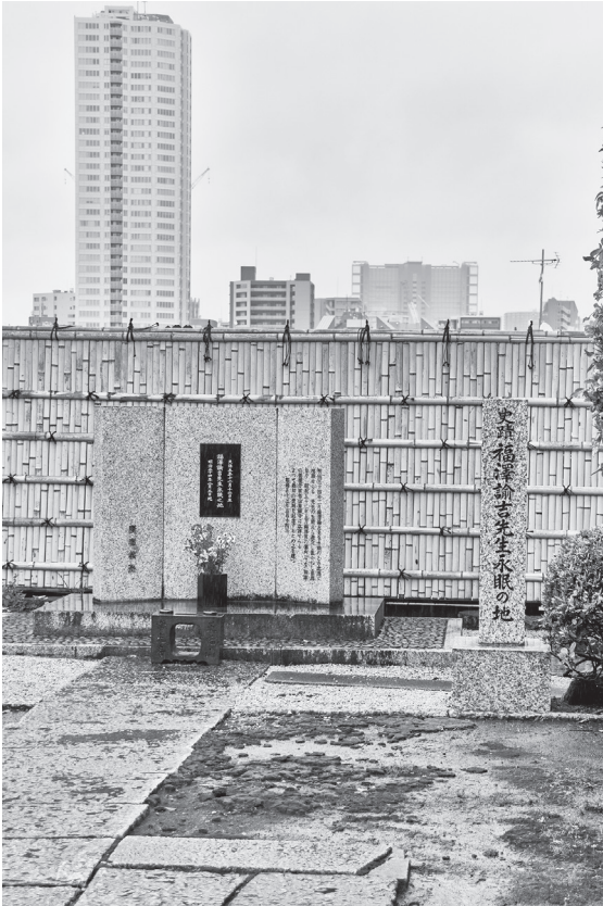
白金台の常光寺にある福澤諭吉永眠の地の碑