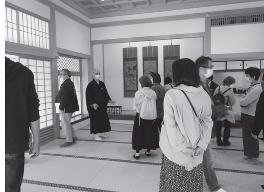
上：カルナラ・コレッジ '21の様子、2021年9月 下：泉岳寺見学会、2023年3月