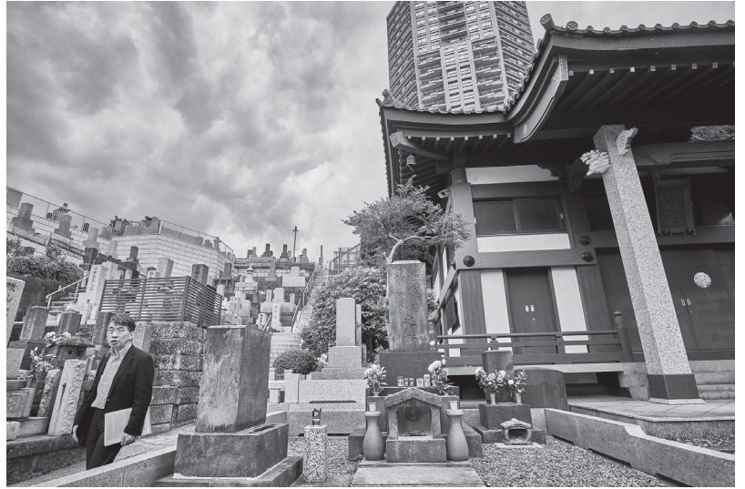
麻布十番の善福寺にある福澤諭吉の墓

か、いろんなナラティブがありますね。そこから掘り起こしていくと、慶應義塾とは何かも見えてくるはずですよ。