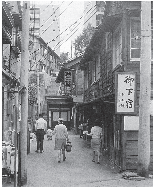
三田小山町の様子(加藤嶺夫『東京の消えた風景』小学館、2003年)