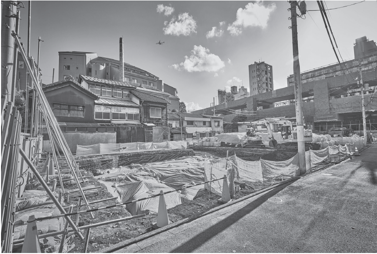
三田小山町の再開発