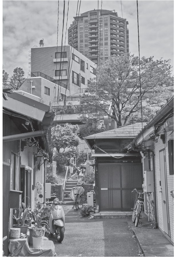
麻布の谷間から元麻布ヒルズを見上げる

ながら、今はその基盤が掘り崩されつつあることに目を向ける必要があります。カルチュラル・ナラティヴは、都市のあちこちで進行している巨大再開発に対する対抗的なナラティヴにならなくてはいけない。慶應義塾大学の周りでも、ものすごい再開発が次々に起こっているということですね。高輪ゲートウェイのあたり、高輪から麻布にかけての再開発もすさまじい。カルチュラル・ナラティヴは、そういう現代都市の状況とどのように切り結んでいくことができるのでしょうか。